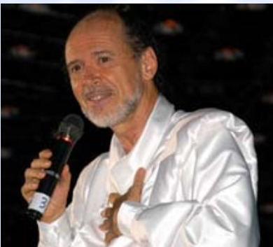
RAËL, Leader spirituel du Mouvement Raëlien